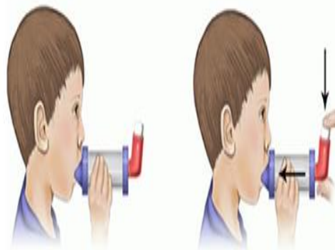
۳. تمام هوای درون ریه خود را خالی کنید و سپس اسپیسیر را در دهان گذاشته و با دندانها فشار دهید. خود را عقب نکشید.